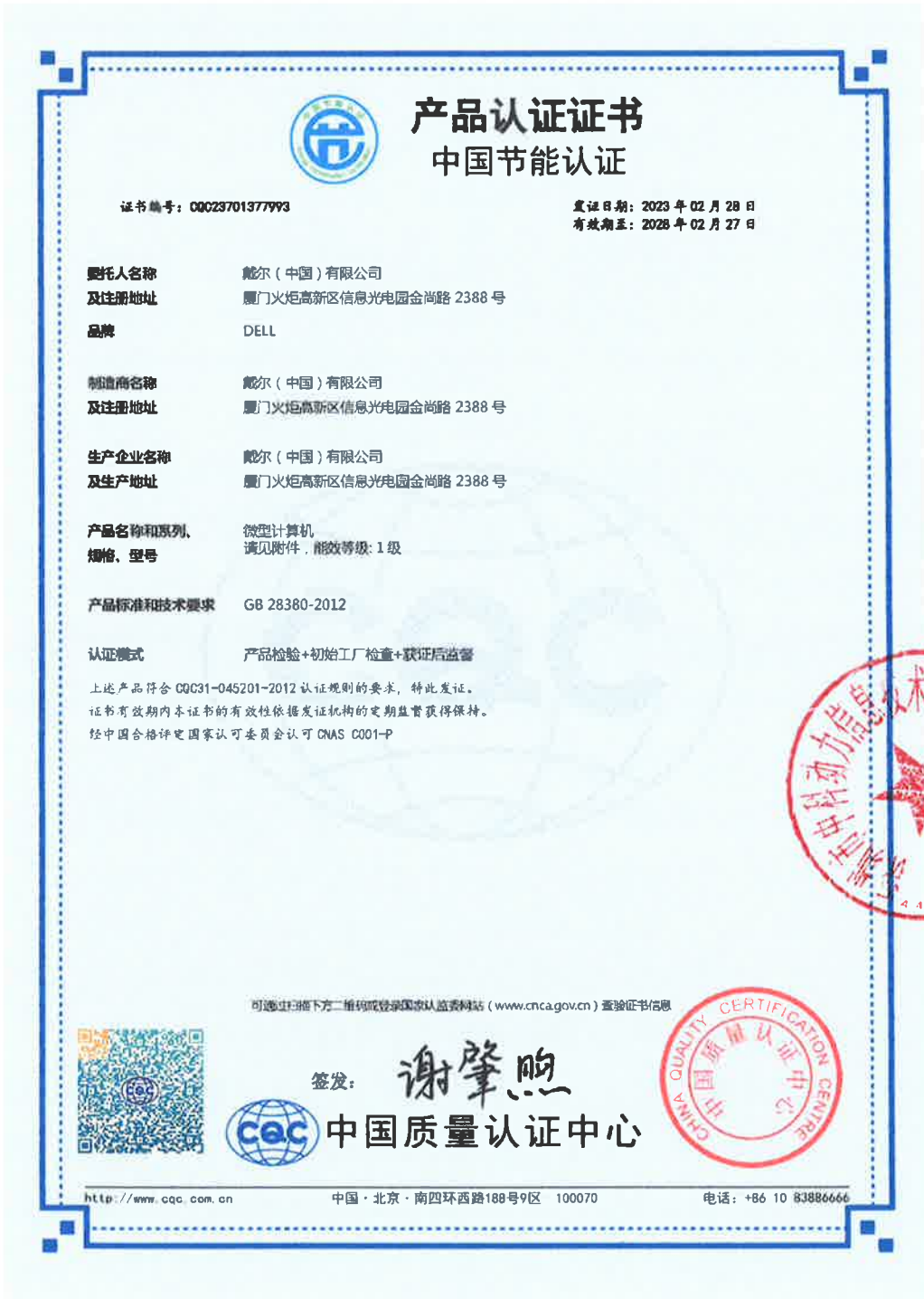
附件 1 戴尔 OptiPlex Tower 7010 410047 中国节能认证证书

3.若本项目竞价采购的产品有属于政府强制采购节能产品范围的（空调、台式计算机（含一体机）、手提电脑（含平板电脑）、激光打印机、针式打印机、电视机等），供应商应在应答文件中提供所投产品的有效的节能产品认证证书扫描件。当本项目竞价采购的产品不属于政府强制采购节能产品范围内的，无需提供节能产品认证证书。