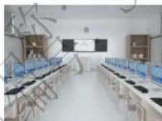
设计类专业机房场景