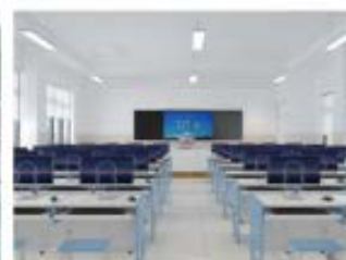
机房教学及管理场景