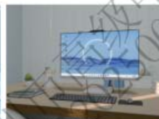
教师备课、网课教学场景