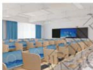
英语听说考试场景