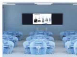
人工智能实验室场景